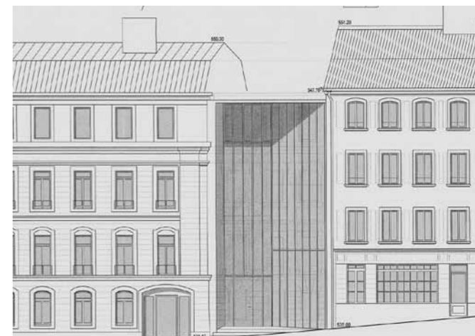
Projet Rosebud. Vue de l'entrée rue Cité-Devant 11. Plan d'enquête.

Ce projet était très controversé au sein même du jury qui l'a finalement retenu à une faible majorité. Le rapport du jury fait état des importantes réserves d'une forte minorité de ses membres. « Le jugement final a donné lieu à des débats nourris sur l'empreinte symbolique du Parlement, siège de l'Autorité législative et sur son impact visuel sur la Cité. [...] Contrairement aux pratiques usuelles, une minorité importante du jury a souhaité exprimer son point de vue sur le projet retenu. En effet, bien que respectant le cahier des charges, celui-ci détruit selon elle trop de vestiges historiques des fondements du parlement existant. Il estime que la percée de la rue Cité-Devant 11, pour créer un accès, n'a pas de justificatif historique et crée une discontinuité du bâti urbain.