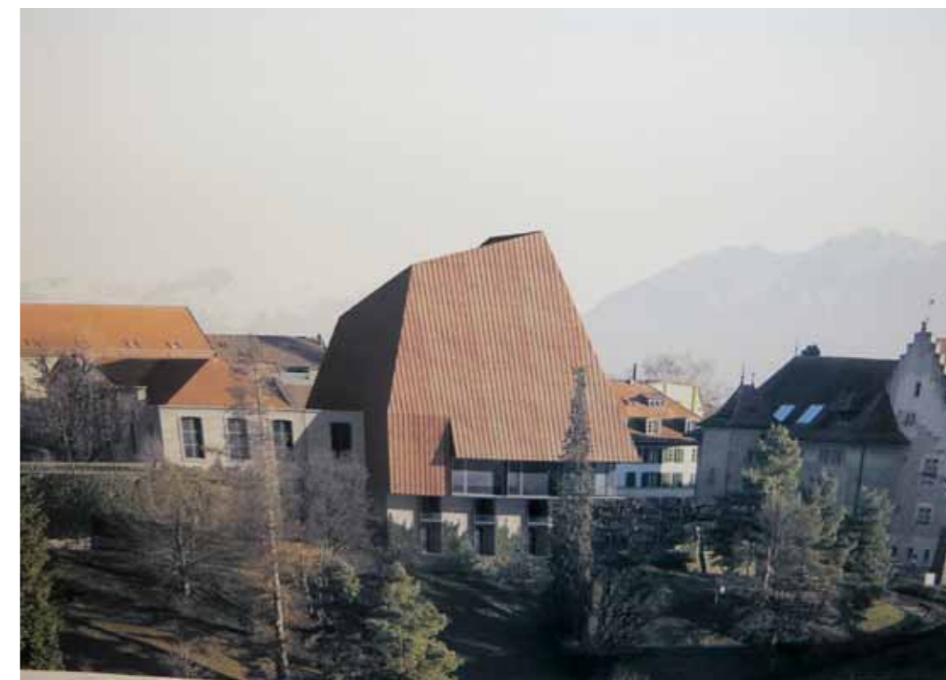
Projet de reconstruction du parlement. Vue ouest.

MDL - Case postale 6929 - 1002 Lausanne www.mdl-lausanne.ch info@mdl-lausanne.ch téléphone et télécopieur: 021 617 37 67